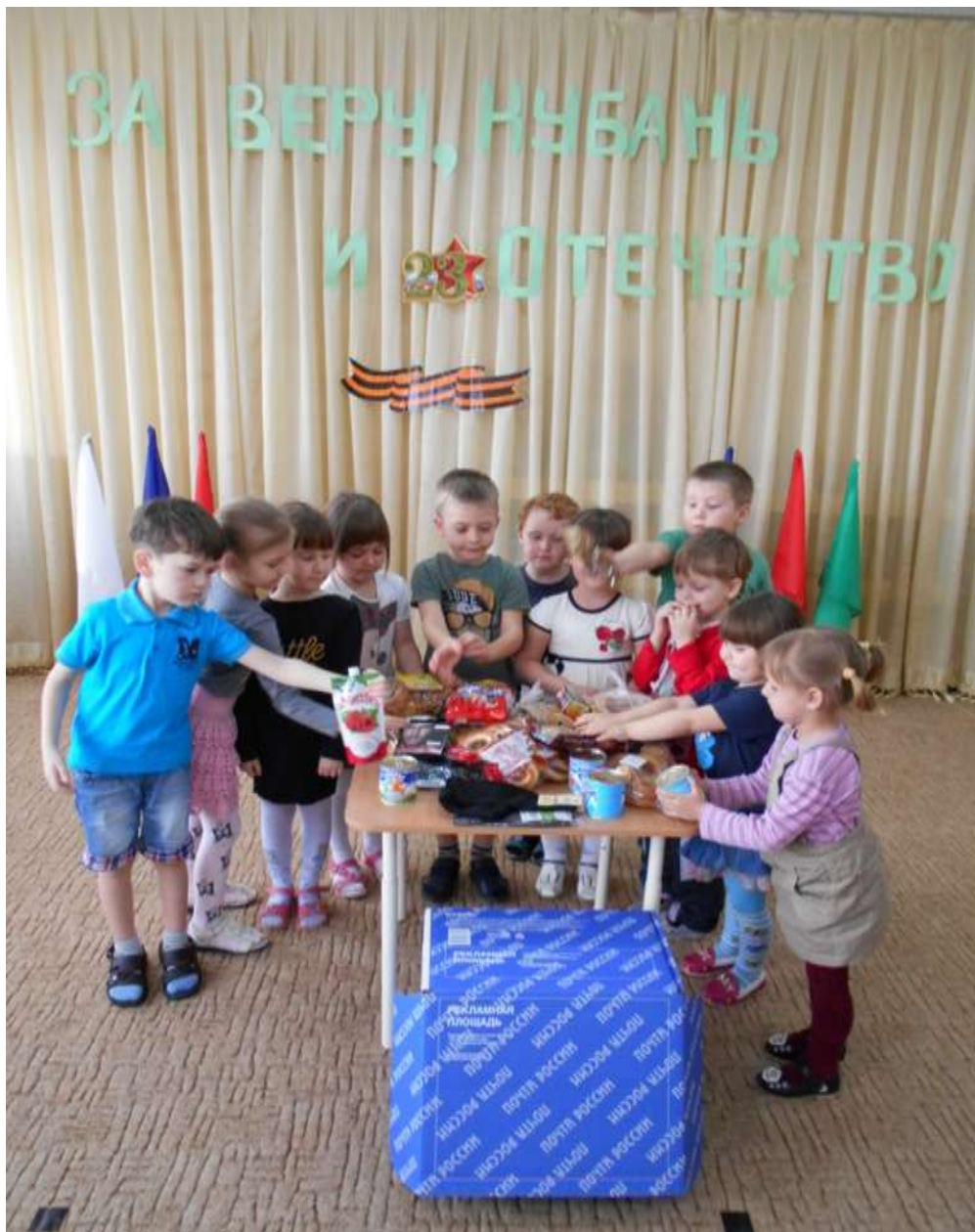
А еще наши дети участвовали в акции «Посылка солдату»