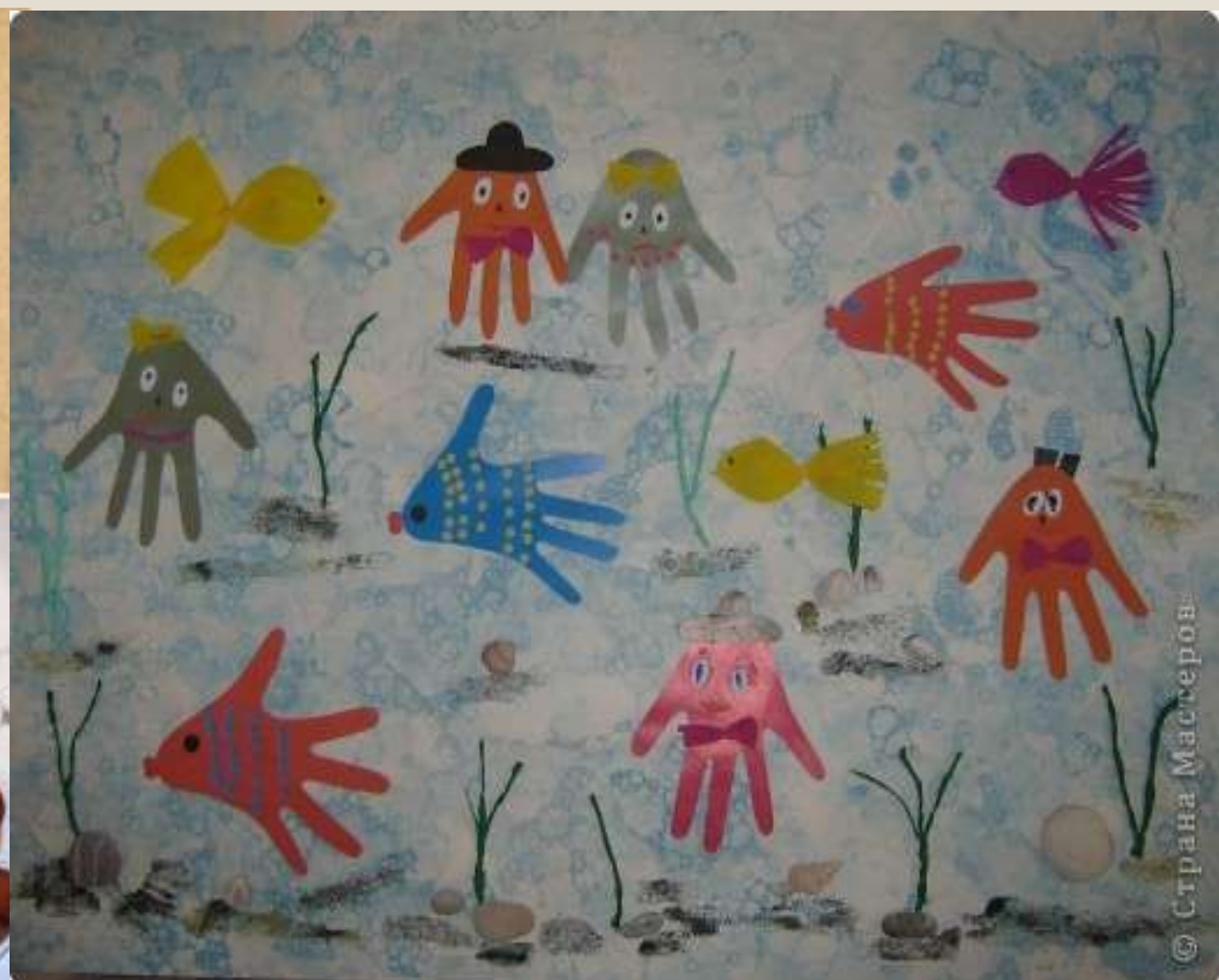
Печатки из пластилина