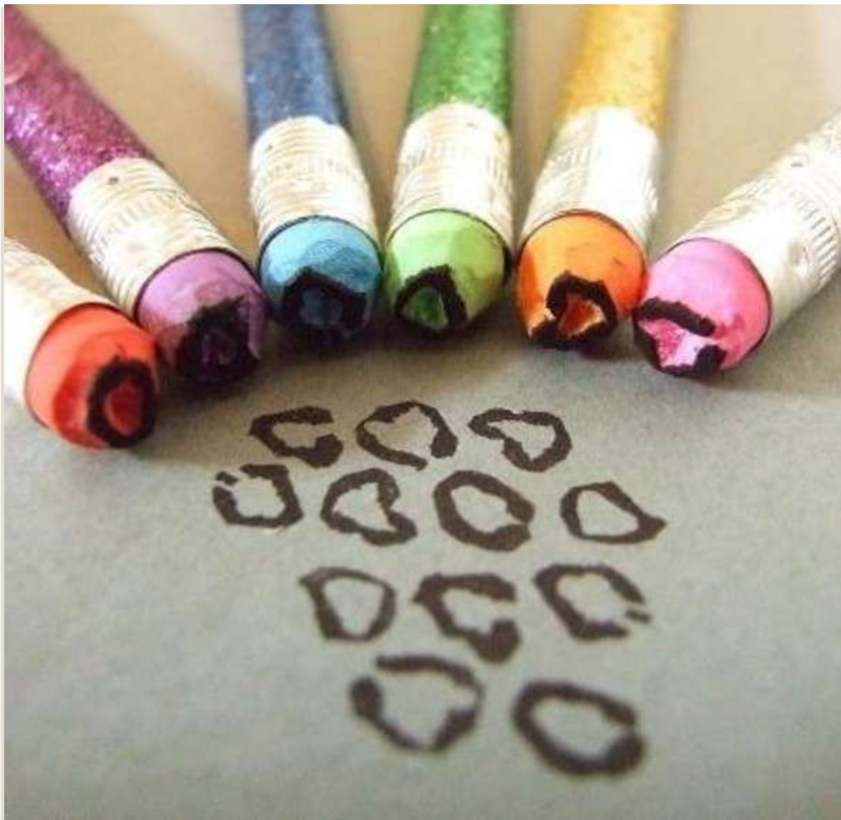
Свёрнутая в трубочку бумага.