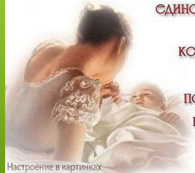
Настроение в картинках

ЭТО ЕДИНСТВЕННЫЙ ЧЕЛОВЕК, КОТОРЫЙ ЛЮБИТ ТЕБЯ ПО-НАСТОЯЩЕМУ ПРОСТО ЗА ТО, ЧТО ТЫ ЕСТЬ