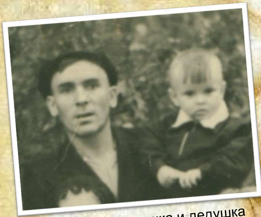
Прадедушка и дедушка