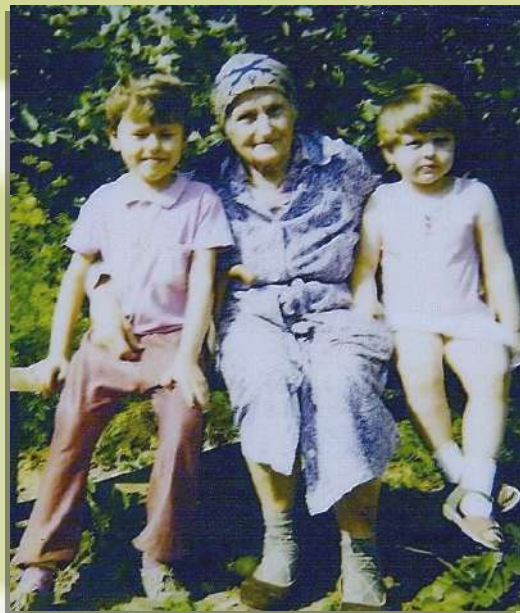
Моя прапрабабушка, мама и дядя.